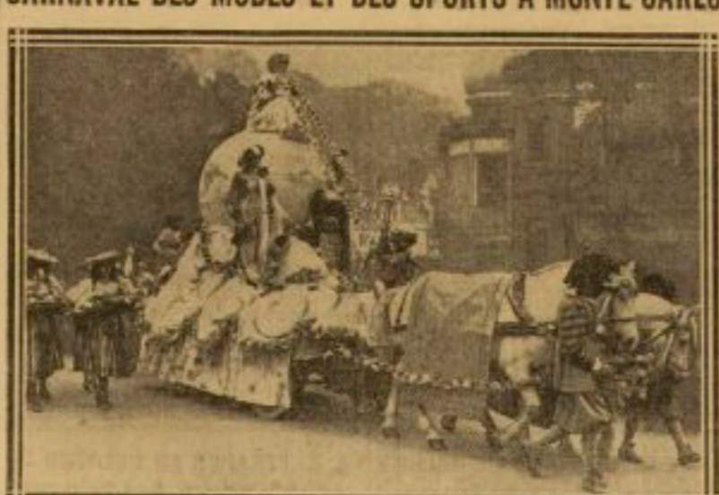
LE CHAR DE LA MODE (1922). ÉMILIO A. MONTE-CARLO. La saison de Monte-Carlo bat son plein. Le carnaval des modes et des sports a obtenu un joli succès d'éclat...