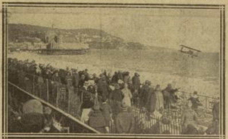
BOSSOUTROT SURVOLE LA JETÉE, PRÈS DU CASINO