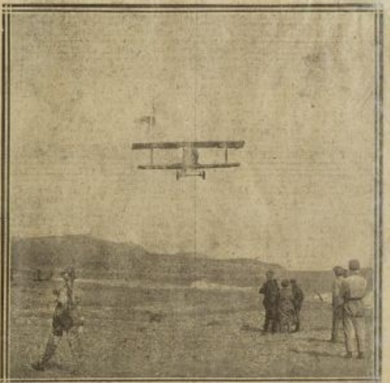
L'APPAREIL DE SADI LECOINTE EN PLEIN VOL