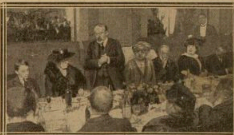
M. LOUIS BARTHOU PRONONCANT SON DISCOURS M. Barthou, ministre de la Justice, a présidé, hier, un déjeuner offert par la Société des Amis de Montaigne à M. Anatole France, à l'occasion de son prix Nobel. L'illustre maître ne put assister à cette solennité, qui se déroula néanmoins comme s'il avait été présent.