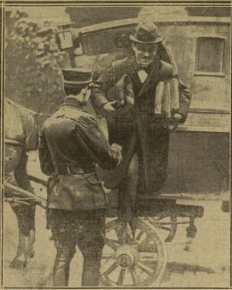
LE TRAITRE SOURIT EN ARRIVANT A LA COUR D'ASSISES