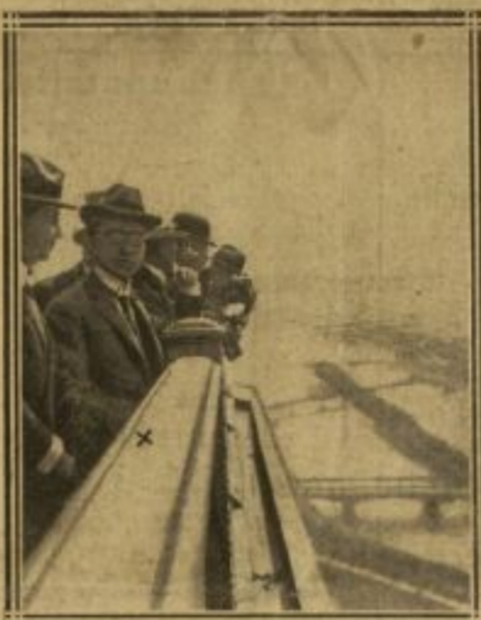
LE PRINCE (x) AU 2 e ÉTAGE DE LA TOUR