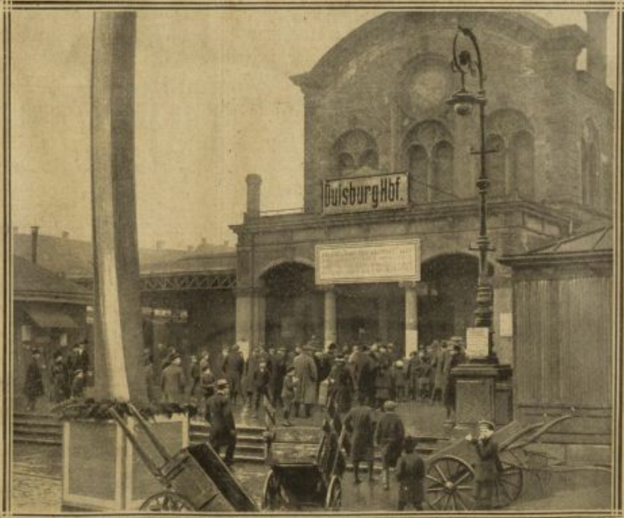
UN APPEL AUX ÉLECTEURS DE LA HAUTE-SILÉSIE, EN GARE DE DUISBURG

Hier-matin, à 11 heures, les troupes françaises sont entrées à Homborn, à 5 kilomètres au nord de Duisburg, dans la région minière. Là, comme ailleurs, tout s'est passé sans incident. C'est hier que toutes les armes détenues par les habitants et la police de sûreté, dite garde verte, ont été livrées. L'activité économique n'a été ralentie à aucun moment par l'occupation. La dernière de nos photo-