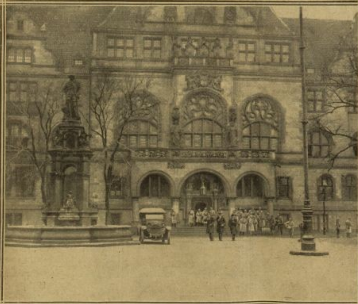
LE RATTHAUS, QUARTIER GÉNÉRAL FRANÇAIS, A DUISBURG

Hier-matin, à 11 heures, les troupes françaises sont entrées à Homborn, à 5 kilomètres au nord de Duisburg, dans la région minière. Là, comme ailleurs, tout s'est passé sans incident. C'est hier que toutes les armes détenues par les habitants et la police de sûreté, dite garde verte, ont été livrées. L'activité économique n'a été ralentie à aucun moment par l'occupation. La dernière de nos photo-