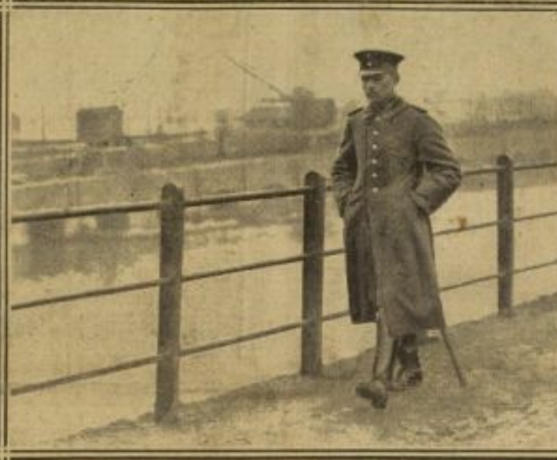
UN HOMME DE LA GARDE VERTE A RUHRORT