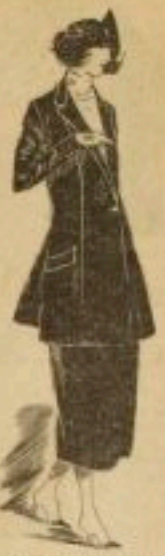
Modèle Martin Tailleur classique en robe de chambre.

Il est amusant de constater la vogue égale du tailleur classique et du tailleur de fantaisie; les femmes partagent leurs faveurs entre le polka-dot et la jaquette serrée, légèrement cintrée, mais laissent cependant la taille tout à fait simple. Le veston anglais, l'autre jour, était modeste de Jérôme d'une coupe impeccable, en un beau tissu à fil à fil. Les grandes lignes, épaules tubulaires de Jérôme, ont été agréablement surprises et apprennent que le bon tailleur classique avait été rebâti pour elles à un prix extrêmement avantageux, offrant toute économie.