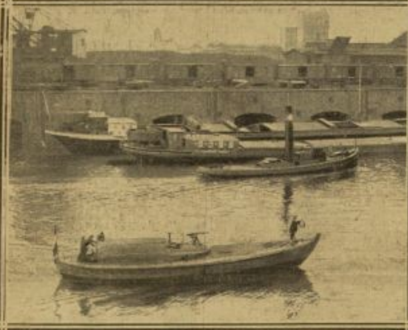
CANONNIÈRE FRANÇAISE DANS LE PORT DE RUHRORT