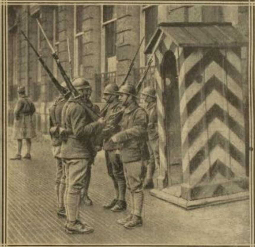
ON PEINT LES GUÉRITES AUX COULEURS FRANÇAISES, A PARK HOTEL — LE G e GAUCHER DANS SON BUREAU — LA RELEVÉ DES SENTINELLES DEVANT PARK HOTEL, A DUSSELDORF