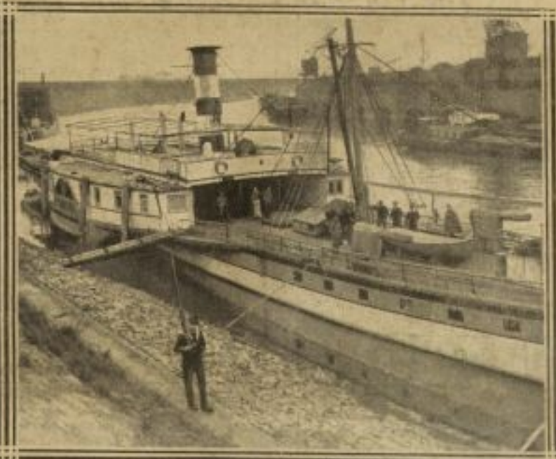
LE « PARCIVAL », A QUAI, VEILLE SUR RUHRORT