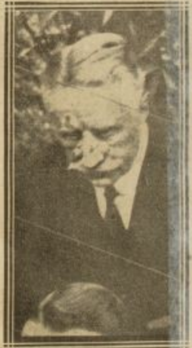
AGRANDISSEMENT DE LA PHOTO CI-CONTRE