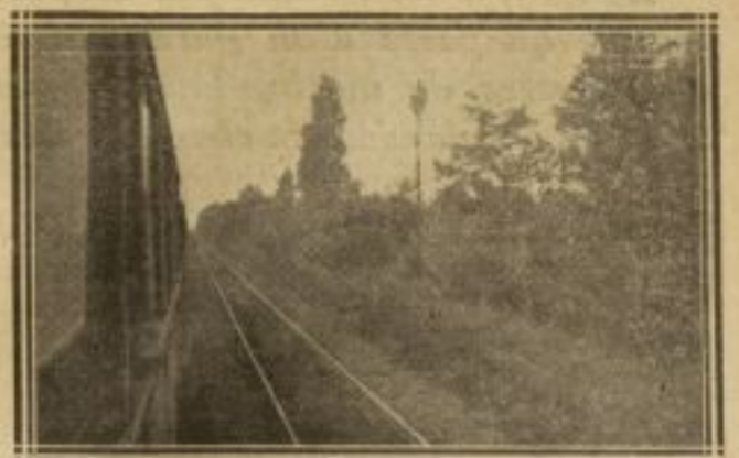
LE POINT OÙ EST TOMBÉ LE PRÉSIDENT DE LA RÉPUBLIQUE