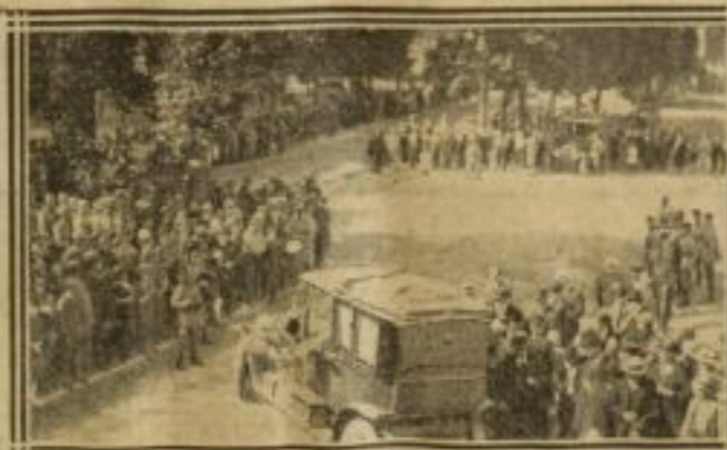
L'AUTO DU PRÉSIDENT QUITTE LA SOUS-PRÉFECTURE