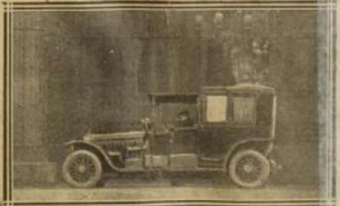
DU PAPIER COLLE AUX VITRES, L'AUTO ARRIVE A L'ÉLYSÉE