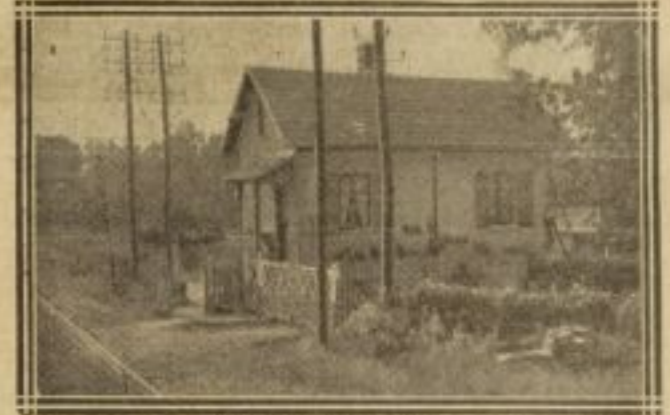
LE POSTE DE GARDE-BARRIÈRE OÙ FUT MÈNÉ M. DESCHANEL