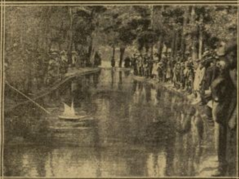
AU BOIS DE BOULOGNE : AUTOUR D'UN PETIT BATEAU