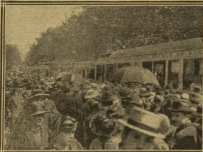
A L'EMBARCADÈRE DU TRAMWAY LOUVRE-VERSAILLES

TOUS LES PARISIENS, HIER, A LA FAVEUR DU BEAU TEMPS, ONT FRANCHI LES MURS DE LA GRAND'VILLE