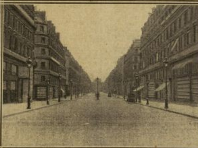
L'AVENUE DE L'OPÉRA, A 2 HEURES DE L'APRÈS-MIDI