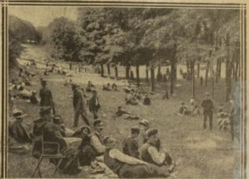
DOUCEURS DE LA SIESTE SUR LES PELOUSES DE S'-CLOUD