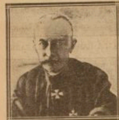
Le général Broussiloff.

L'officier soviétique. On lui redonne son pouvoir. On le réhabilite. On le réhabilitait.