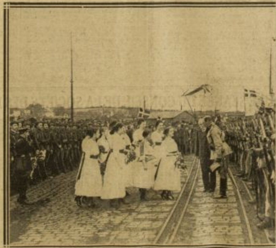
JEUNES FILLES OFFRANT DES FLEURS AUX OFFICIERS

Le Slesvig du Nord, qui demanda avec une forte majorité à être rattaché à la mère patrie, n'avait pas vu de soldats danois depuis 1864. Ceux-ci ont été reçus par nos chasseurs alpins chargés de l'occupation pendant le plébiscite.