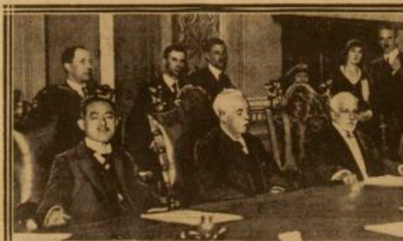
LES DÉLÉGUÉS REUNIS AU PALAIS CHIGI, SOUS LA PRÉSIDENCE DE M. TITTONI. De gauche à droite: MM. Matsui (Japon), Balfour (Grande-Bretagne), Tittoni (Italie), Erich Drummond (secrétaire général), León Bourgeois (France) et Quiñones de León (Espagne).