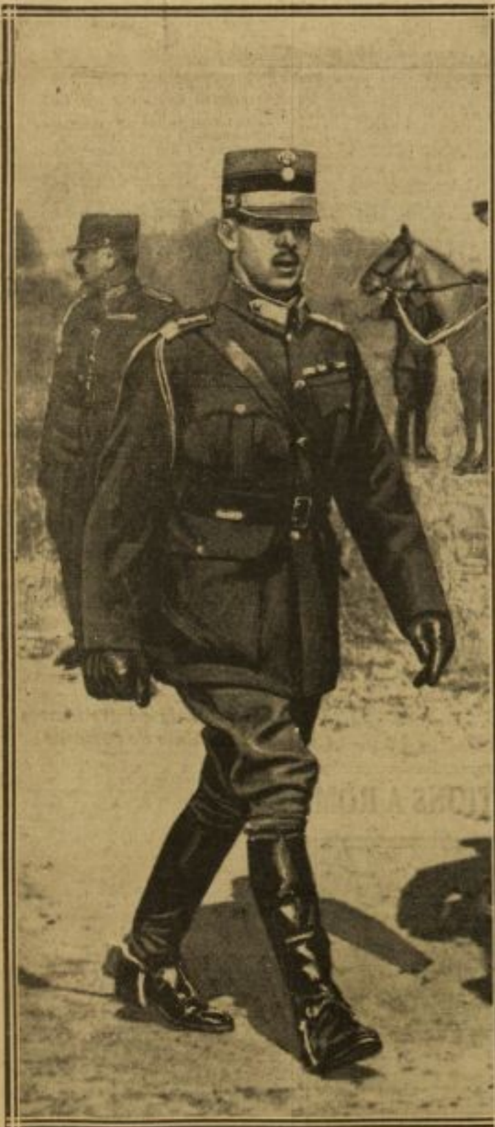
LE ROI ALEXANDRE DE GRECE

Le souverain des Hellènes, qui voyage incognito, arrive ce matin à Paris, à 10 heures. Second fils du roi Constantin, le roi Alexandre, qui est né en 1893, règne depuis juin 1917.