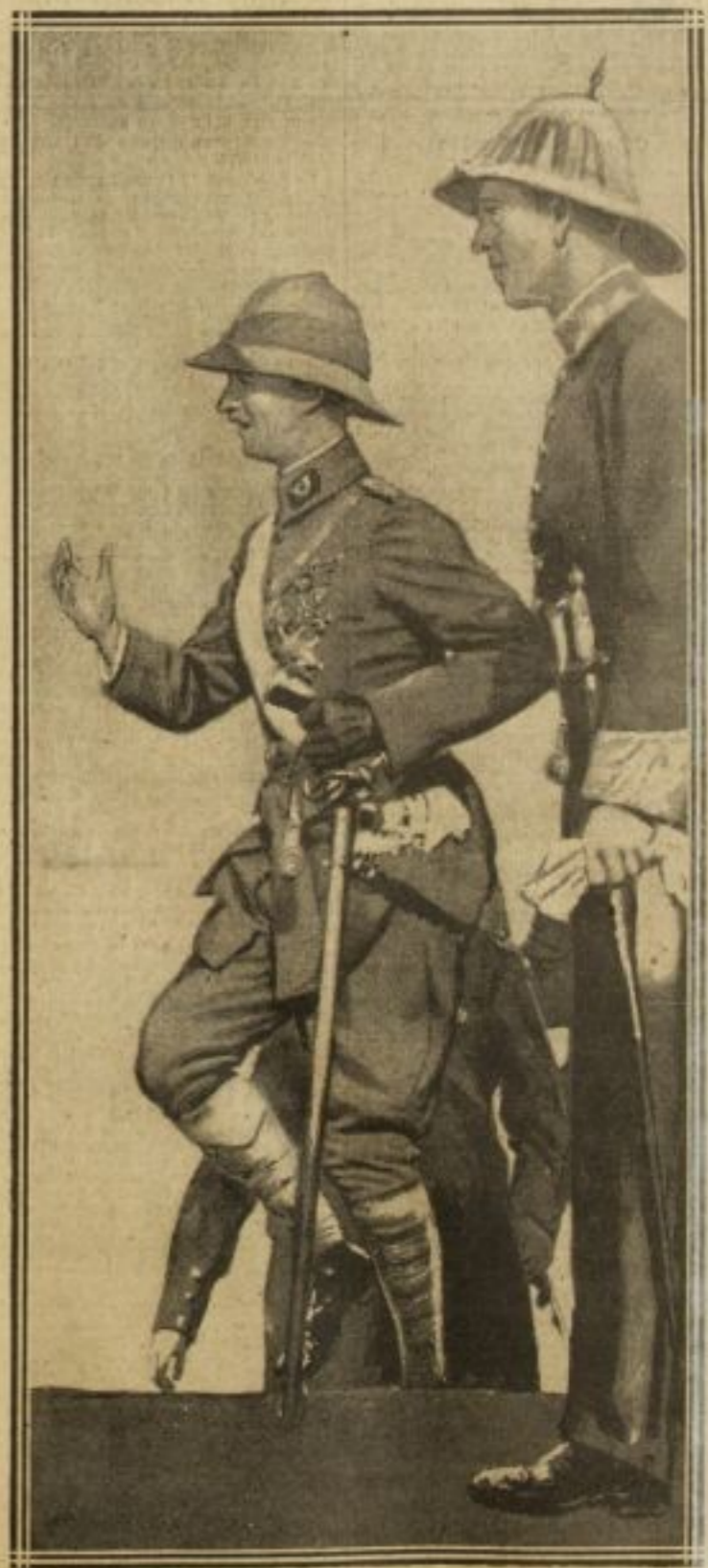
LE PRINCE CAROL A BOMBAY

Le Slesvig du Nord, qui demanda avec une forte majorité à être rattaché à la mère patrie, n'avait pas vu de soldats danois depuis 1864. Ceux-ci ont été reçus par nos chasseurs alpins chargés de l'occupation pendant le plébiscite.