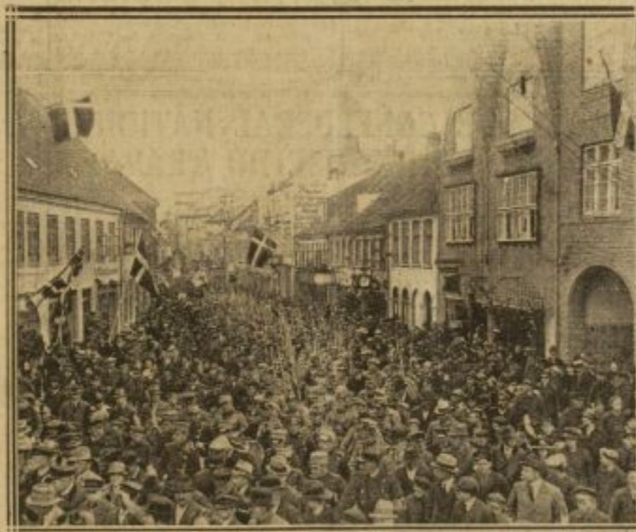
UN DETACHEMENT DE SOLDATS DANOIS ENTRE A HADERSLEV

Le souverain des Hellènes, qui voyage incognito, arrive ce matin à Paris, à 10 heures. Second fils du roi Constantin, le roi Alexandre, qui est né en 1893, règne depuis juin 1917.