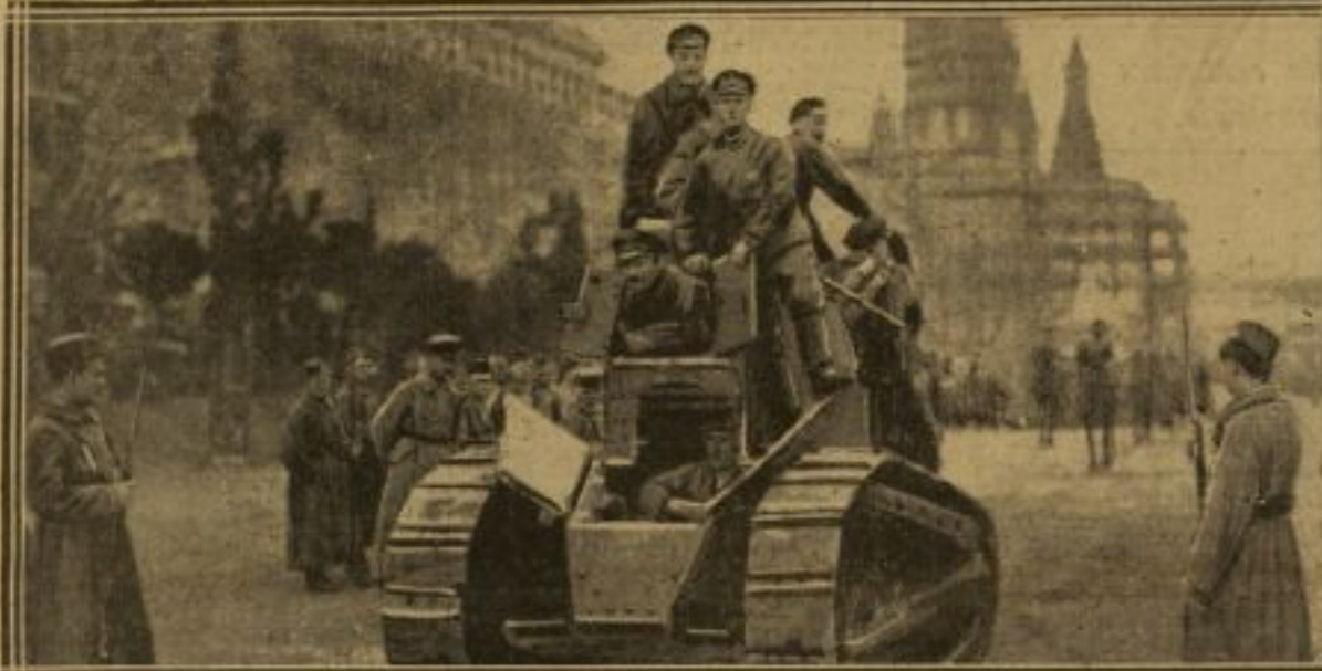
UN TANK DE FABRICATION FRANÇAISE PASSANT SUR LA PLACE ROUGE, A MOSCOU