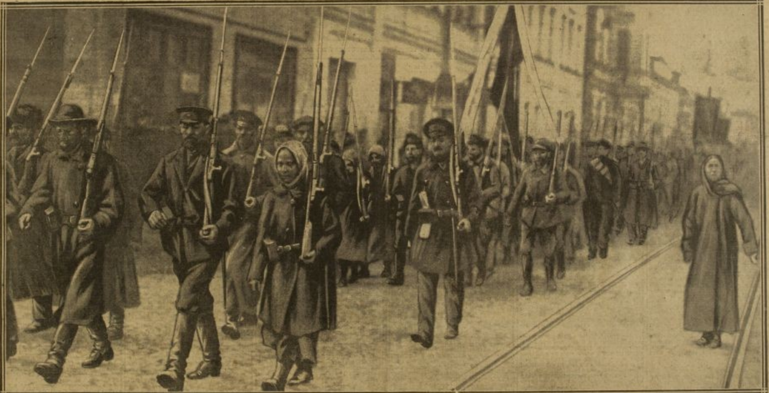
L'ARMÉE ROUGE, COMPRENANT DES FEMMES ET DES VOLONTAIRES EN CIVIL, DÉFILE DANS UNE RUE DE MOSCOU, AVANT DE PARTIR POUR LE FRONT POLONAIS