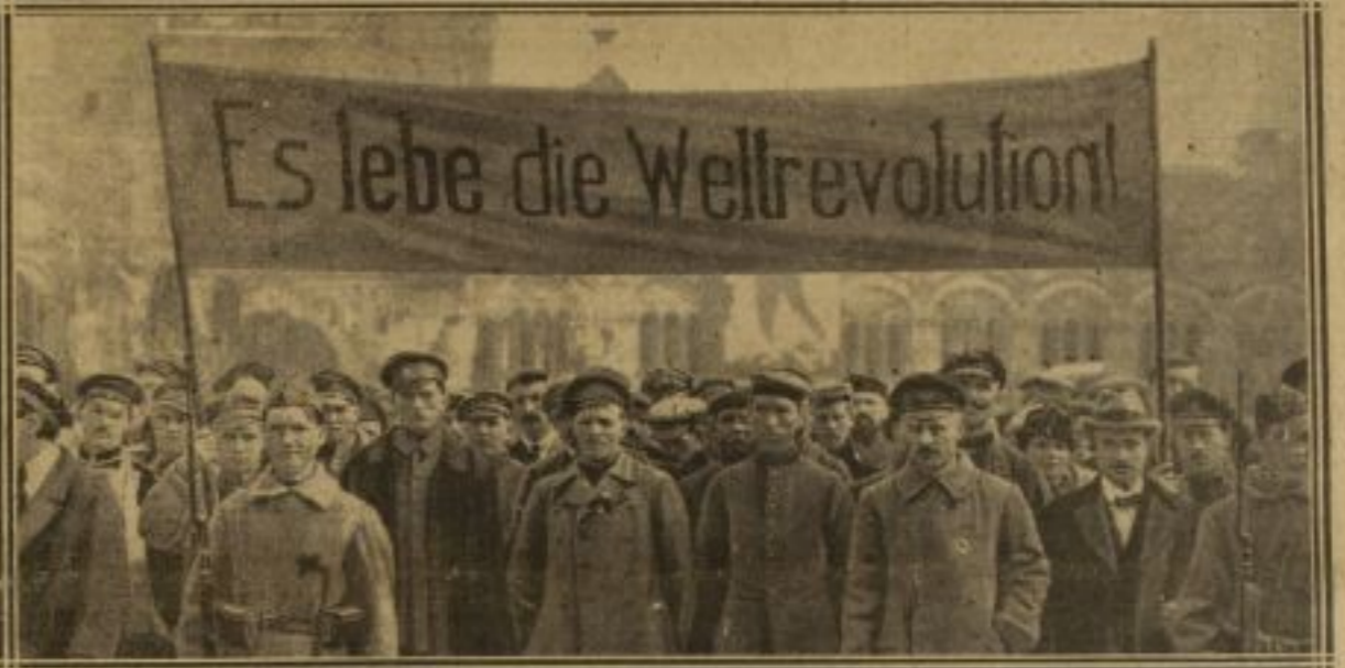
RUSSES ET ALLEMANDS. — SUR LA PANCARTE : « VIVE LA RÉVOLUTION MONDIALE ! »