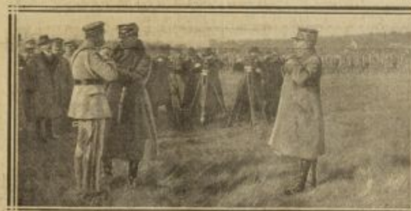
LE MARÉCHAL FAIT DÉGRAFER SA PROPRE MÉDAILLE...

Hier matin, un peu après 9 heures, le maréchal Pilsudski et M. Millerand arrivaient en automobile sur le plateau de Satory. Ils étaient accompagnés de M. Barthou, ministre de la Guerre, du maréchal Foch, ainsi que de plusieurs généraux polonais et français. Le bataillon de Saint-Cyr et un peloton de l'escadron de l'école, casaco au shako, rendaient les honneurs. Le maréchal Pilsudski, les ayant passés