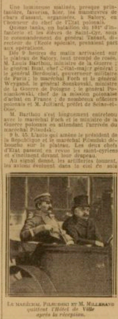
Le maréchal Pilsudski et M. Millerand quittent l'Hôtel de Ville après la réception.

Dans une déclaration les gouvernements de France et de Pologne confirment leur volonté de coordonner leurs efforts.