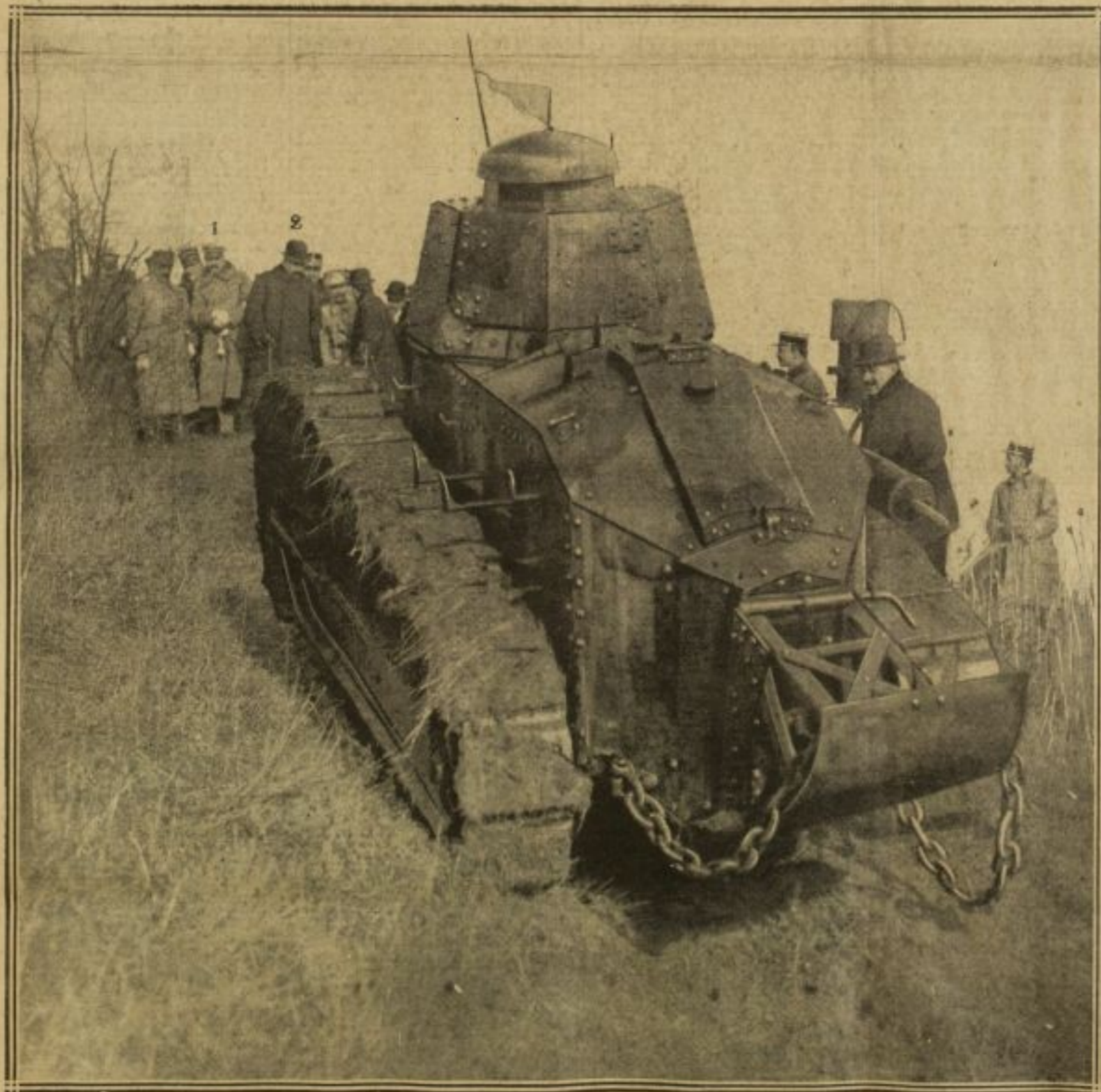
LE MARÉCHAL PILSUDSKI (1) ET M. MILLERAND (2) REGARDENT PASSER UN CHAR D'ASSAUT

Hier matin, un peu après 9 heures, le maréchal Pilsudski et M. Millerand arrivaient en automobile sur le plateau de Satory. Ils étaient accompagnés de M. Barthou, ministre de la Guerre, du maréchal Foch, ainsi que de plusieurs généraux polonais et français. Le bataillon de Saint-Cyr et un peloton de l'escadron de l'école, casaco au shako, rendaient les honneurs. Le maréchal Pilsudski, les ayant passés