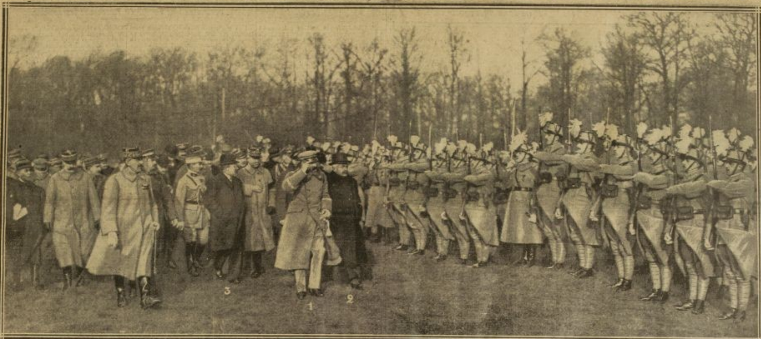
LE CHEF DE L'ÉTAT POLONAIS (1), ACCOMPAGNÉ DE M. MILLERAND (2) ET DE M. BARTHOUS (3), PASSE EN REVUE LE BATAILLON DES SAINT-CYRIENS