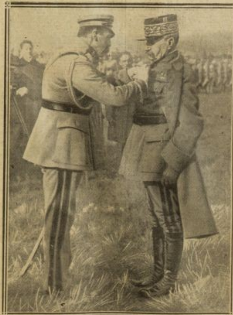
... ET L'ACCROCHE SUR LA POITRINE DU MARÉCHAL FOCH

en revue, assista à une manœuvre très réussie de notre artillerie d'assaut. Sous ses yeux, quatorze tanks évoluèrent avec une lourde aisance sur un terrain très accidenté. A l'issue de cette démonstration, le chef de l'Etat polonais, prenant sa médaille de la Valeur militaire, que venait de lui enlever un officier de sa suite, l'accrocha sur le dolman du maréchal Foch.