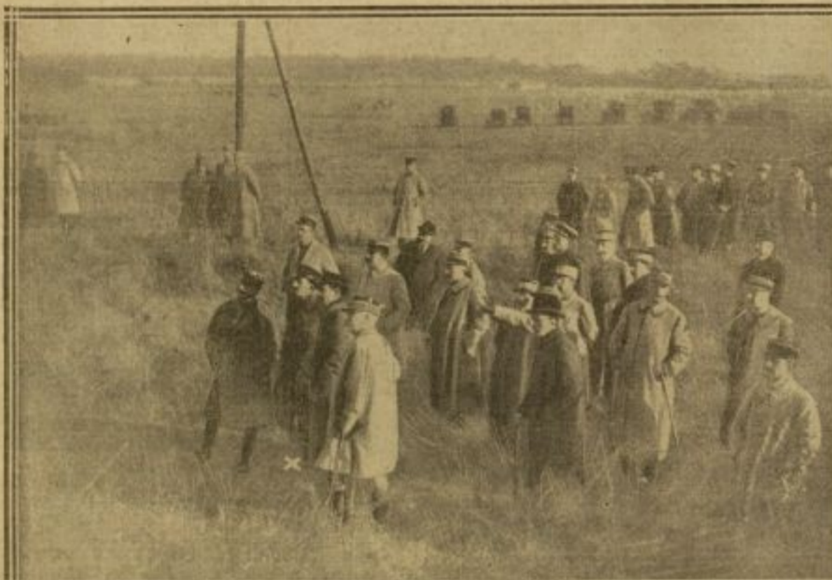
LE ROI (X) REGARDE ÉVOLUER DES ESCADRILLES D'AVIONS