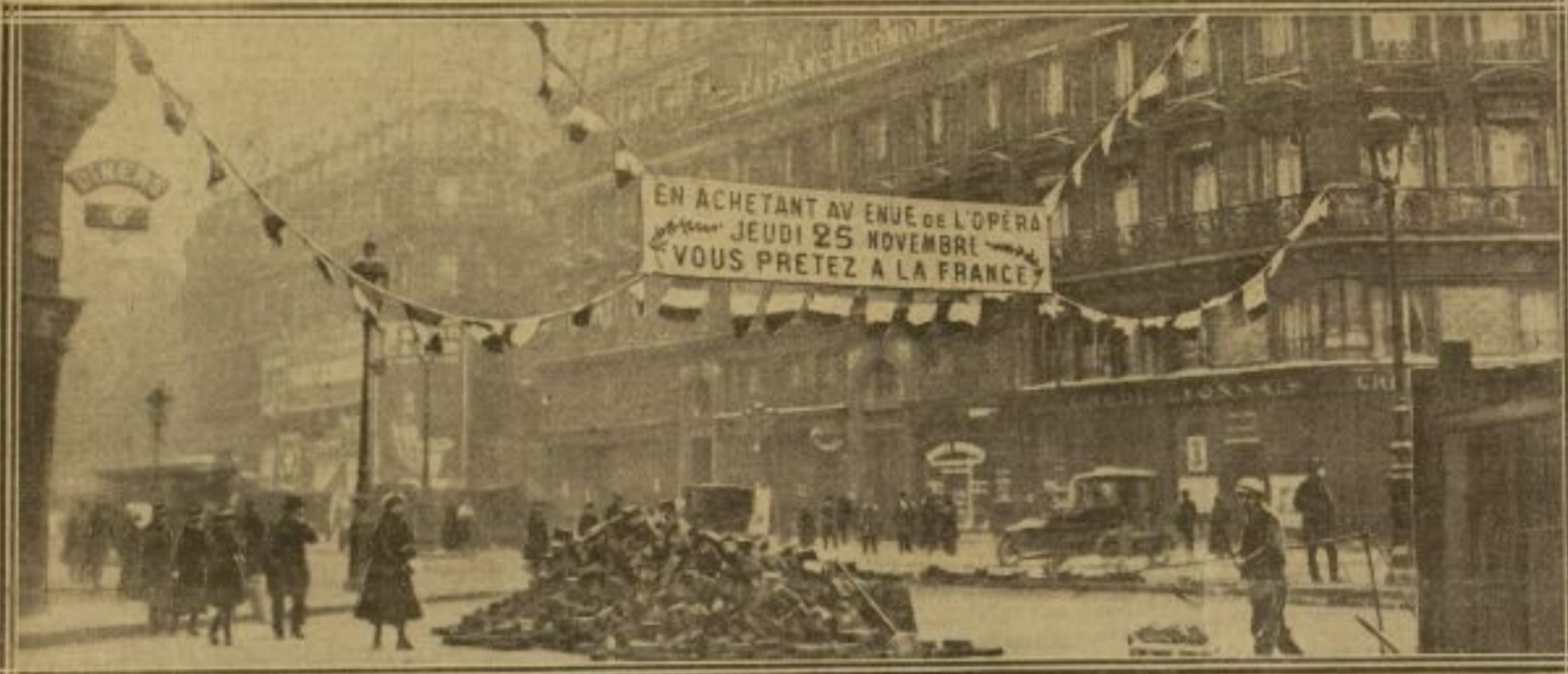
UN DES MOTIFS DÉCORATIFS LES PLUS TYPIQUES QUI SOLLICITENT LE PUBLIC DE RÉALISER AUJOURD'HUI UN MAXIMUM D'ACHATS. C'EST À LA FRANCE, EN EFFET, ET NON AUX COMMERÇANTS, QU'IRONT TOUS LES APPORTS FINANCIERS DE LA JOURNÉE DU 25 NOVEMBRE, DITE "JOURNÉE DU COMMERCE", AUX MAGASINS PARISIENS